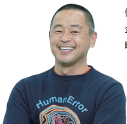
株式会社 POPS クリエイティブディレクター/コピーライター

企業はブランディングを行うことによって顧客に共感や信頼を提供することができる。その基本的な概念と地域企業における重要性を理解し、自社のブランディング戦略の構築に役立つ知識と実務的スキルを身につける。