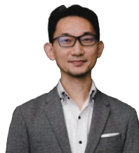
合同会社 Judgeplus 代表