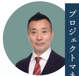
プロジェクトマネジメント