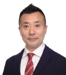
経営情報イノベーション専門職大学 (iU) 特任教授

「プロジェクトマネジメント力 = 幹事力」という独自の視点から、プロジェクトの基本的プロセス設計とマネジメントスキルを理解し、生産性と効果を向上させるための手法を実践的に身につける。